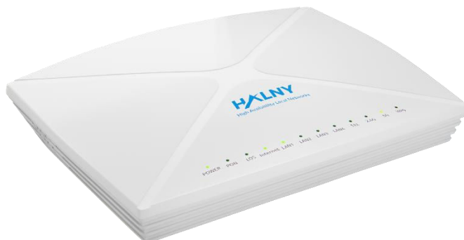
Rys. 1 Panel przedni