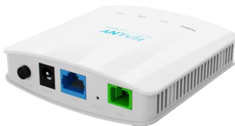
Rys. 2 Panel tylny