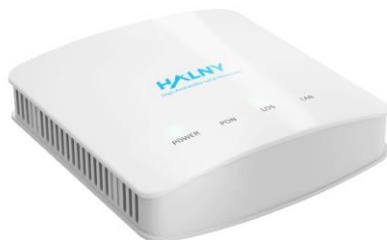
Rys. 1 Panel przedni